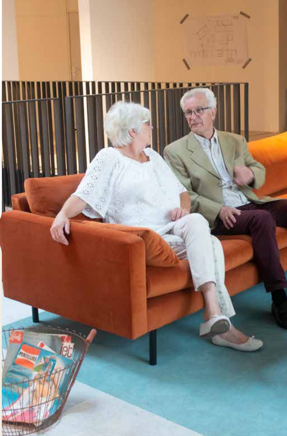
Gelukkig ouder worden in Liv inn Hilversum